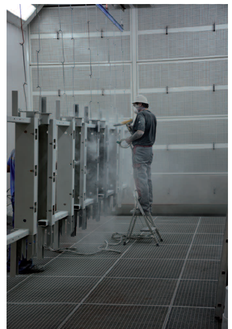
Die Großraum-Pulverkabine ist nicht mit einer Tür, sondern mit einer horizontalen Luftführung zur Kabinenrückwand ausgestattet.

Die gegenüberliegende Washkabine kann sowohl für die manuelle Reinigung als auch für vollautomatische Vorbehandlung genutzt werden. Für letzteres ist sie mit einem fahrbaren Sprühkranz mit herausnehmbarer Mittellanze ausgestattet. Möglich sind damit zwei separate vollautomatische Vorbehandlungslinien: Entfetten/ Eisenphosphatierung, 2 x Kreislauf-Spülen und VE-Spüle für Stahlteile sowie Beizentfetten, 2 x Kreislauf-Spülen, Passivierung (Chrom VI-frei) und VE-Spüle für Werkstücke aus Aluminium und verzinktem Stahl.