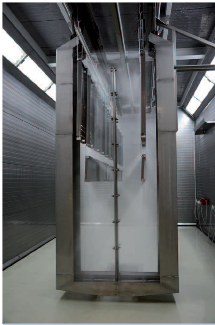
Mit dem fahrbaren Sprühkranz sind zwei separate vollautomatische Vorbehandlungslinien für Stahlteile sowie Werkstücke aus Aluminium und verzinktem Stahl möglich.

Aufgebaut ist die gesamte Anlage in Form eines „H“. Im linken Schenkel befinden sich im unteren Bereich die Strahlkabine sowie im mittleren und oberen Bereich je ein Aufgabe-/Abnahmeplatz, die beide mit einer Hub- und Senkstation ausgerüstet sind. Im rechten Schenkel sind – von unten nach oben – die Washkabine, der Haftwassertrockner, der