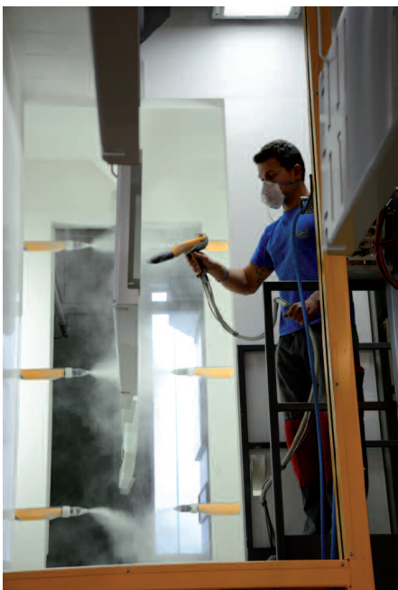
Die Automatikkabine ist zusätzlich mit einem Handbeschichterplatz und einer automatischen Konturerkennung ausgestattet.

Werden die Werkstücke in der Automatikkabine gepulvert, dann müssen die Traversen an die automatische Förderung der Kabine übergeben werden. Hierzu ist die Fördertechnik der Automatikkabine mit einem Reibrad-Transportsystem ausgestattet, das die Traversen mitnimmt und durch die Kabine fährt. Der Durchlauf erfolgt in einer einstellbaren Geschwindigkeit, die in Abhängigkeit von Größe und