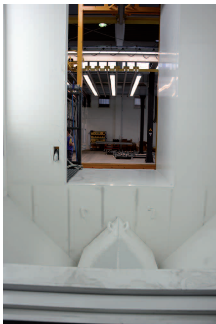
In der Automatikkabine erfolgt die Absaugung des Oversprays über den Bodenkanal, der bei Bedarf herausgenommen werden kann.

Geometrie der Werkstücke zwischen 0,5 und 1,20 m/min liegt. Für die hochwertige Beschichtung ist die Kabine mit einem Handbeschichterplatz und einer automatischen Konturerkennung kombiniert, die über die Steuerungstechnik die Position der beidseitig drei Gema Pistolen und ihren geometriebezogenen Einsatz regelt. Weil PBF Fürst bis zu 15 Farbwechsel pro Tag hat, ist die in Sandwichbauweise erstellte Kunststoff-Kabine so ausgestattet, dass sie sich statisch auflädt, Pulver abstößt und somit leicht zu reinigen ist. Die Absaugung des Oversprays (13.000 m 3 /h) erfolgt über einen Bodenkanal, der zur Kabinenreinigung hochgeklappt werden kann. Nach dem Beschichten werden die Traversen im Eilgang zurück durch die Automatikkabine gefahren und wieder an einen der beiden Querförderer übergeben. „Die Fördertechnik ist so geschaltet, dass vor der Automatikkabine immer ein Querförderer stehen muss“, erklärt Helmut Schultheiß. „Damit stellen wir sicher, dass die Traversen mit den fertig gepulverten Teilen dem nächsten Produktionsschritt zugeführt werden können.“