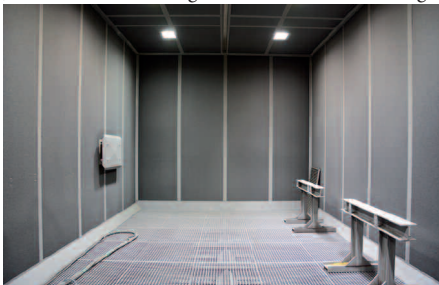
Die Strahlkabine ist zum Abtransport des Strahlmittels mit einem Gitterrost und darunter mit einem Schrabberboden ausgestattet.

Für PBF Fürst gab es mehrere Gründe, das Wimsheimer als Generalunternehmer zu beauftragen: „Zum einen wollten wir für Konzeption und Umsetzung nur einen Ansprechpartner, zum anderen war es uns wichtig, ein Unternehmen zu beauftragen, das entsprechendes Know-how im Anlagenbau für die Beschichtung von großen Teilen besitzt“, berichtet H. Fürst rückblickend. MEEH Jumbo Coat GmbH agiert im Pulverbeschichtungs-